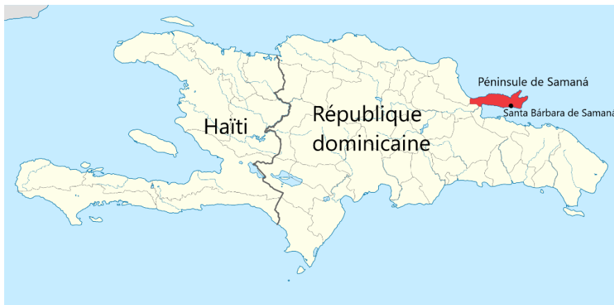
Fig. 1. La péninsule de Samaná sur l'île d'Hispaniola.

Il n'existe pas de pays homogène sur le plan linguistique. En ce sens, les concepts de langue officielle et de langue nationale ne font état que d'une partie de la réalité linguistique des pays, de même que des entités subétatiques comme les provinces, états, cantons, etc. Dans le cas de la République dominicaine, l'unilinguisme officiel de l'État (Boyer) cache une réalité bien différente, soit celle d'un pays multilingue qui a accueilli diverses communautés linguistiques, tant de langues autochtones, coloniales et postcoloniales, dont des créoles, et autres, au fil du temps. La communauté anglophone de la péninsule de Samaná, dans le nord-est de l'île d'Hispaniola (voir carte ci-dessous), est l'une d'entre elles. La langue patrimoniale de cette communauté bicentenaire, l'anglais de Samaná, a été transplantée de la côte est des États-Unis au début du XIX e siècle par des Afro-Américains affranchis ayant immigré dans la région dans le cadre d'un programme mis en place par le gouvernement de la nouvelle République d'Haïti, qui comprenait à l'époque l'actuelle République dominicaine. Nous dressons ici un portrait historique de la réalité linguistique de la péninsule de Samaná, puis nous nous concentrerons sur la communauté de langue anglaise de descendance afro-américaine. Nous revenons ensuite sur la diversité linguistique du pays, cette fois dans une perspective contemporaine.